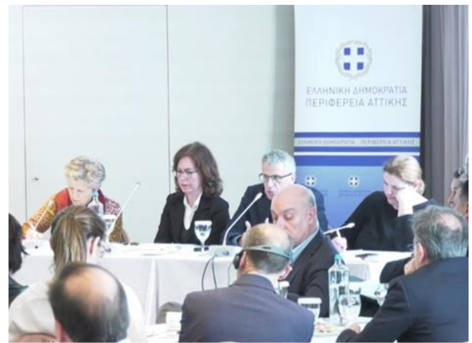
Εικόνες 7,8 & 9: Πάνελ εισηγητών 2 ου Εργαστηρίου Διαβούλευσης (04/04/2023)

Κατόπιν ολοκλήρωσης των παρουσιάσεων, δόθηκε χρόνος για παροχή διευκρινήσεων από τη μελετητική ομάδα. Μετά το πέρας των διευκρινήσεων, οι συμμετέχοντες είχαν τη δυνατότητα να διαβουλευτούν σε ομάδες και να προτάξουν τις κοινής αποδοχής ιδέες ανά τραπέζι συμπληρώνοντας τη Φόρμα Παράθεσης Προτάσεων Εμπλουτισμού αλλά και παρουσιάζοντας αυτές στην ολομέλεια. Τέλος, οι συμμετέχοντες είχαν τη δυνατότητα να παραθέσουν οποιαδήποτε επιπλέον ιδέα επιθυμούσαν, και δεν συμπεριλήφθηκε για οποιοδήποτε λόγο στην ομαδική καταγραφή, μέσω της ατομικής Φόρμας Παράθεσης Προτάσεων Εμπλουτισμού.