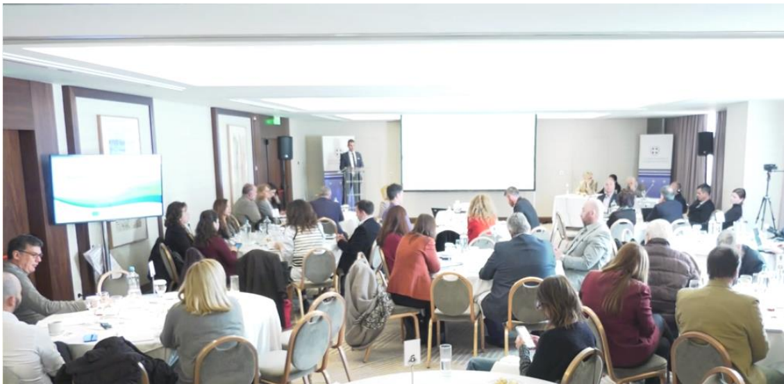
Εικόνα 11: Διαβούλευση σε ομάδες - 3 ο Εργαστήριο Διαβούλευσης (05/04/2023)

Μετά το πέρας των διευκρινήσεων, οι συμμετέχοντες είχαν τη δυνατότητα να διαβουλευτούν σε ομάδες και να προτάξουν τις κοινής αποδοχής ιδέες ανά τραπέζι συμπληρώνοντας τη Φόρμα Παράθεσης Προτάσεων Εμπλουτισμού αλλά και παρουσιάζοντας αυτές στην ολομέλεια. Τέλος, οι συμμετέχοντες είχαν τη δυνατότητα να παραθέσουν οποιαδήποτε επιπλέον ιδέα επιθυμούσαν, και δεν συμπεριλήφθηκε για οποιοδήποτε λόγο στην ομαδική καταγραφή, μέσω της ατομικής Φόρμας Παράθεσης Προτάσεων Εμπλουτισμού.