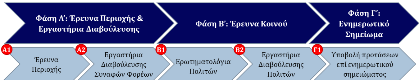
Εικόνα 1: Προέγγιση συμμετοχικού σχεδιασμού ανάπλασης Φαληρικού Όρμου

Τα Εργαστήρια Διαβούλευσης αποτελούν το δεύτερο βήμα της 1 ης Φάσης μιας πολύπλευρης προσέγγισης, που δημιουργήθηκε προκειμένου να εξασφαλίσει τη συμπερίληψη φορέων και πολιτών με απώτερο στόχο τον εμπλουτισμό του σχεδίου Ανάπλασης.