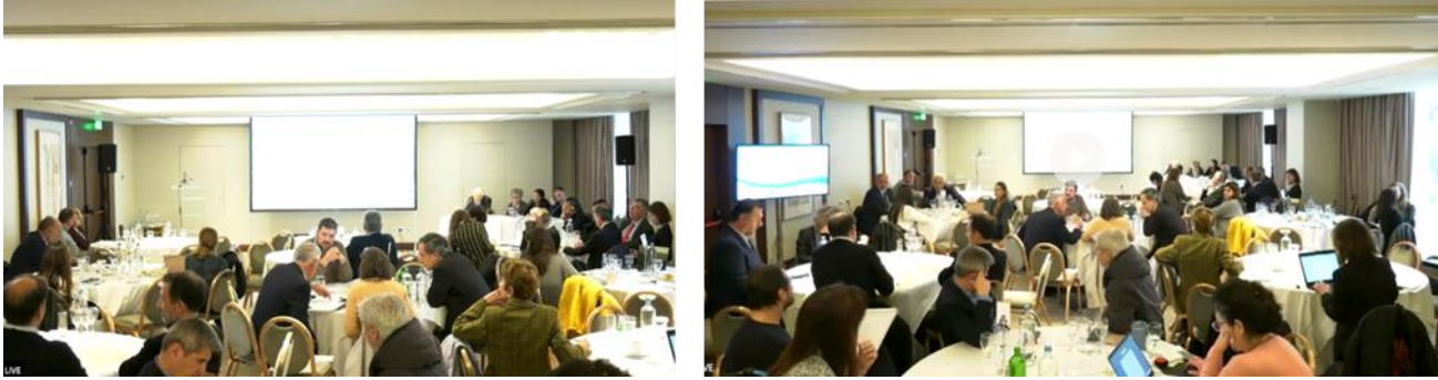
Εικόνες 5 & 6: Διαβούλευση σε ομάδες - 1 ο Εργαστήριο Διαβούλευσης (03/04/2023)

Η σύνοψη και το κλείσιμο του Εργαστηρίου Διαβούλευσης της 1 ης ημέρας πραγματοποιήθηκε από τον κ. C. Rasmussen, Επικεφαλής Γενικής Διεύθυνσης Περιφερειακής Αστικής Πολιτικής (DG REGIO) της Ευρωπαϊκής Επιτροπής.