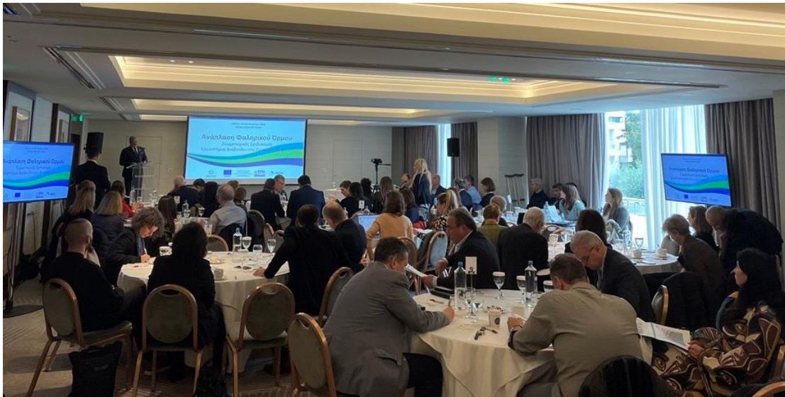
Εικόνα 3: Έναρξη Εργαστηρίων Διαβούλευσης (03/04/2023)

Οι εργασίες της πρώτης ημέρας εκκίνησαν με τους χαιρετισμούς των κ. Γ. Πατούλη, Περιφερειάρχη Αττικής, κ. C. Rasmussen, Επικεφαλής Γενικής Διεύθυνσης Περιφερειακής Αστικής Πολιτικής (DG REGIO) της Ευρωπαϊκής Επιτροπής και κ. Γ. Ζερβό, Ειδικό Γραμματέα του Υπουργείου Ανάπτυξης & Επενδύσεων.